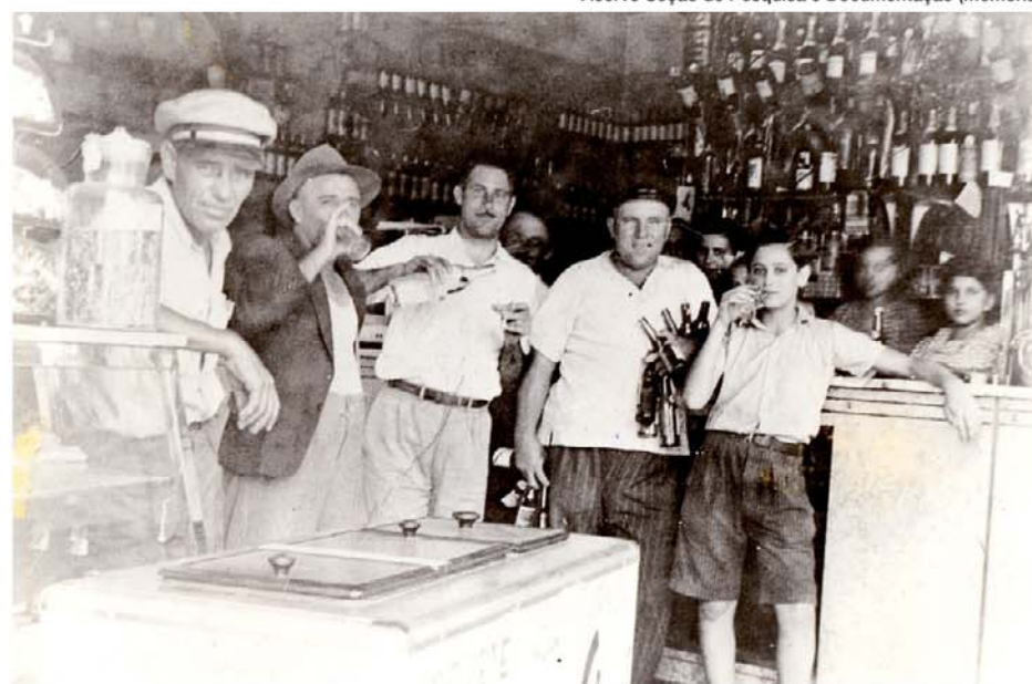
Roupas e costumes de época no bar Coringa, na Rua Marechal Deodoro

Câmara de Cultura Antonino Assumpção. Exposição até 30 de abril, segunda a sexta-feira, das 9h às 19h, e ao sábado, das 9h às 14h. Rua Marechal Deodoro, 1.325, Centro. Informações: 4125-0054.