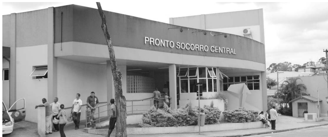
PS Central enfrenta problemas de infraestrutura devido à falta de espaços adequados às urgências e emergências

Sobrecarregado com essa enorme demanda, o Pronto-Socor-