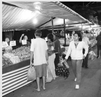
Feira acontece das 19h às 23h

A atividade supre a demanda de bairros como Centro, Jardim