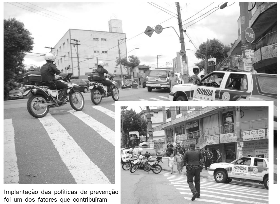
Implantação das políticas de prevenção foi um dos fatores que contribuíram

Dentro do território de implantação, são realizadas ações intersecretariais que contam com a participação direta da comunidade. Paralelamente, foi instalada a primeira Inspeção Regional da Guarda Civil Municipal, que tem como objetivo aproximar a GCM da comunidade ampliando a sensação de segurança. De-