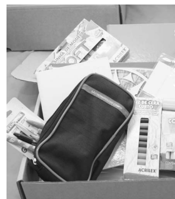
Kits são compostos por 51 itens

Os kits de material escolar foram divididos por modalidades de ensino que vão desde o Berçário I, Ensino Infantil, Básico, Fundamental e Especial, até a Educação de Jovens e Adultos (EJA). Cada kit possui 51 itens e, entre os fornecedores, estão empresas importantes do setor como Copimax,