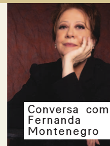
Conversa com Fernanda Montenegro

A atriz vem a São Bernardo para fazer uma leitura de textos apresentando, sob seu olhar, as inúmeras formas de ser e se sentir mulher. Esta leitura será voltada a todas as mulheres interessadas e, principalmente, ao grupo Mulheres de Paz . Teatro Lauro Gomes - Rua Helena Jacquey, 171, Rudge Ramos. Tel: 4368-3483 - Dia 23 (quarta), 20h30