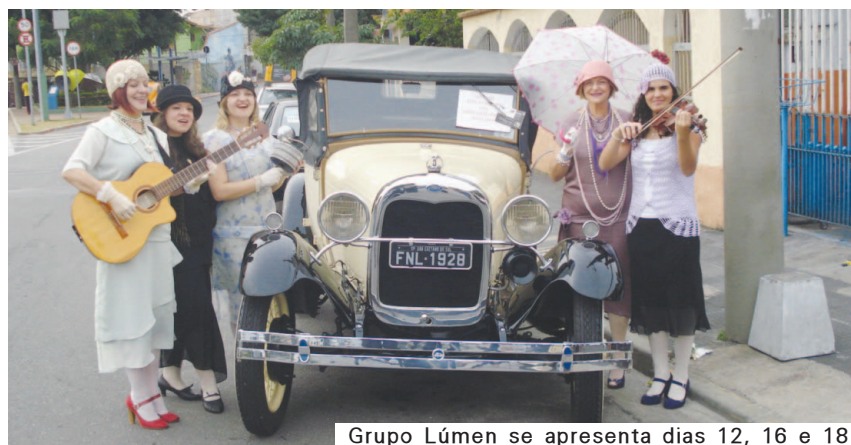
Grupo Lúmen se apresenta dias 12, 16 e 18

Otto. Haverá ainda caminhada, serviços e programas para as mulheres, exposição de produtos e apresentações culturais. A programação inclui ainda a realização da Semana de Prevenção do Câncer de Útero e Mama em todas as unidades de saúde e no Centro de Atenção Integral à Saúde da Mulher (Caism). A programação completa está disponível no site www.saobernardo.sp.gov.br .