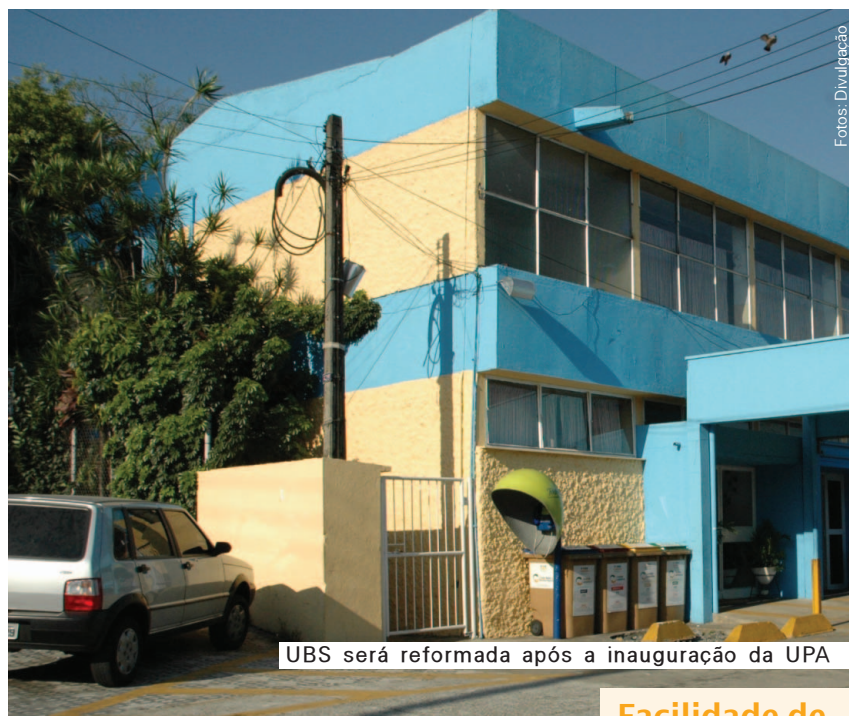
UBS será reformada após a inauguração da UPA

Assim que for inaugurada a UPA Paulicéia/Taboão, a Prefeitura irá reformar e ampliar o prédio da UBS. A nova UBS contará com maior número de médicos, além de novos espaços e serviços, incluindo a Estratégia de Saúde da Família.