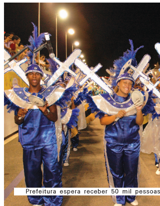
Prefeitura espera receber 50 mil pessoas

no espaço reservado para a praça de alimentação, que contará com 40 barracas. A venda irregular será fiscalizada por 42 agentes e não será permitido circular nas arquibancadas com garrafas e latas. Os destilados continuam proibidos.