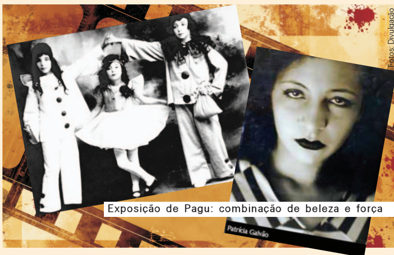
Exposi o de Pagu: combina o de beleza e for a

segunda a sexta, das 8h às 18h30, e s bado das 8h às 13h30. Biblioteca Monteiro Lobato - Rua Jurubatuba, 1415, Centro. Tel: 4330-2888. Dia 22 (terça), 19h