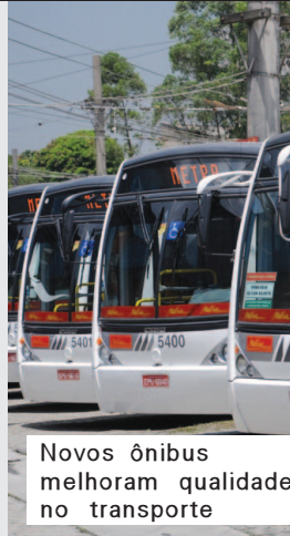
Novos ônibus melhoram qualidade no transporte

adquiridos pela Concessionária Metra, beneficiarão diariamente 250 mil passageiros com mais conforto, segurança e acessibilidade. A solenidade de entrega contou com a presença do prefeito de São Bernardo.