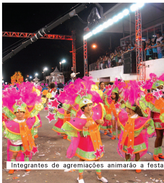
Integrantes de agremiações animarão a festa