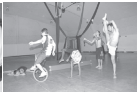
Oficinas de música e artes circenses também terão ações integradas

dade da Cajuv que está fazendo sucesso é o Juventude no seu Bairro, que faz parte do Programa Cidade Viva, promovendo atividades de lazer, cultura, e inclusão social. Uma vez por semana, uma equipe leva equipamentos de esportes radicais até os moradores que não têm acesso a esse tipo de modalidade e lhes ensinam a prática esportiva. Lá, acontecem clínicas de skate, bicicleta e patins.