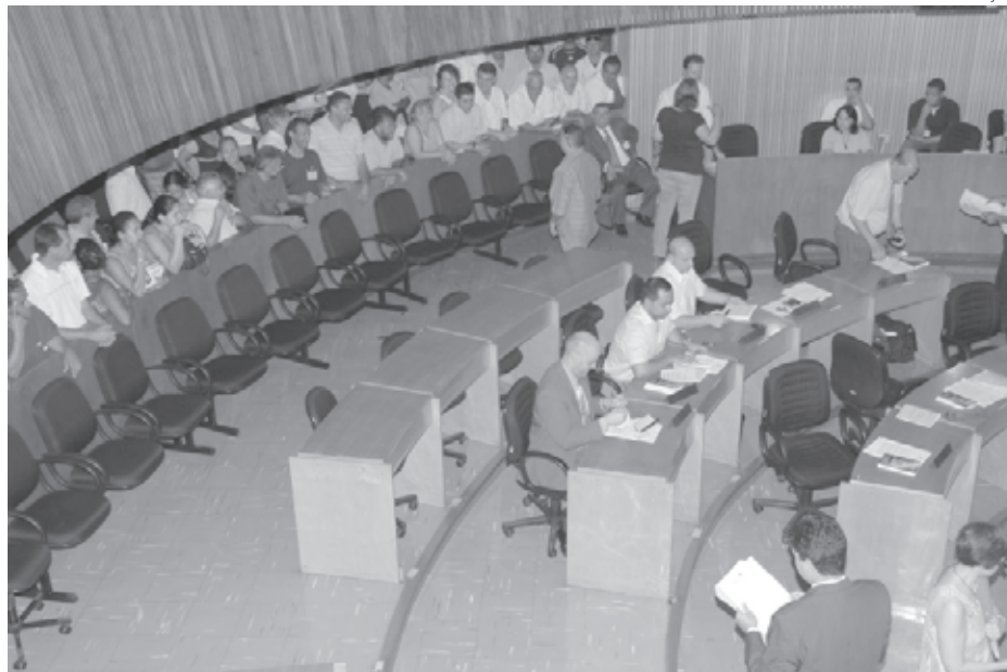
Moradores do DER pedem ajuda dos parlamentares para resolver problemas de habitação

Já no gabinete da presidência, acompanhado dos líderes de todos os partidos representados na Câmara Municipal de São Bernardo e do secretário de Governo, o che-