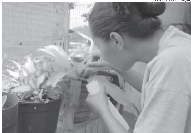
Agentes de Saúde fazem vistorias de casa em casa procurando focos do mosquito

Em São Bernardo, a campanha de combate à dengue é permanente. Cinquenta agentes do Centro de Controle de Zoonoses fazem vistoria de casa em casa nos bairros da cidade, passando orientações e procurando focos do mosquito Aedes aegypti . No entanto, o mais preocupante é que,