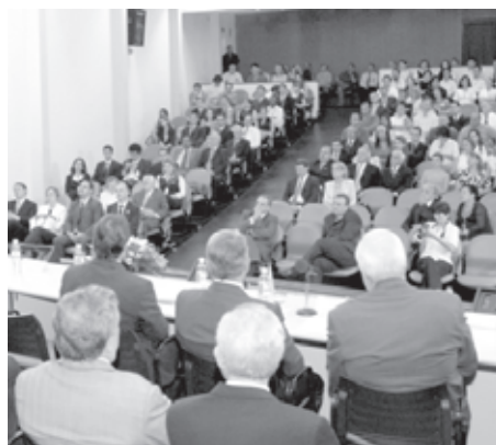
Novo diretor tomou posse em fevereiro

"Nos próximos dias, estaremos enviando um projeto de lei com algumas modificações importantes que nós temos que adotar para os próximos quatro anos de mandato. Pretendemos retornar aqui a fim